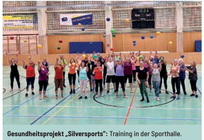
Gesundheitsprojekt „Silversports“: Training in der Sporthalle.

Weitere Informationen unter j.pammer@medspace.at oder 0664 4275825