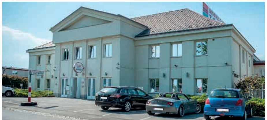
Asylquartier: Außenansicht des Gebäudes in der Raiffeisenstraße 4.

Bürgermeister Christian Gepp sagte: „Ich bin froh, dass es nach vielen guten Gesprächen zu so einer schnellen und zu so einer guten Entscheidung für die Nachnutzung des Areals durch das Bundesministerium für Inneres kommen wird.“