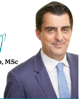
Christian Gepp, MSc Bürgermeister der Stadt Korneuburg