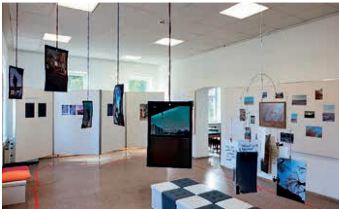
Museum Korneuburg: Ausstellung der Sequenz 2 von „STOPOVER Korneuburg“

Mai 2024 im Stadtmuseum Korneuburg zu sehen. Sonntags von 9–12 Uhr können Interessierte einen Einblick in die Sicht von Jugendlichen zum Thema „Unterwegs“ gewinnen.